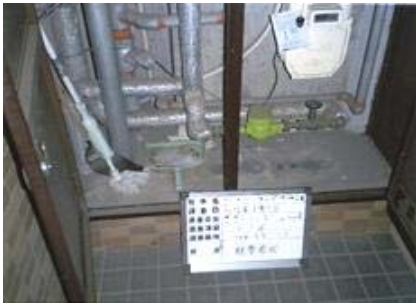
106号室PS内 部位:戸別配管